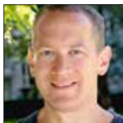
Der Luzerner Komponist Cyrill Schürch.

Das von der Katholischen Kirche Luzern unterstützte Projekt entstammt einer Idee der Chorleitenden an den Luzerner Kirchen, neue Musik für die Liturgie zu fördern.