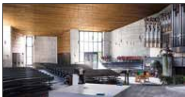
Innenansicht der Kirche St. Michael.

Am Tag der modernen sakralen Architektur öffnen verschiedene Kirchen ihre Türen. Besuchern wird aufgezeigt, wie Architekten neun ausgewählte Sakralbauten in ihrer jeweiligen Zeit neu und modern interpretierten. Die Inszenierung der Bauten mit der Auswahl des Standortes, der Form, den Farben, dem Licht-einfall und der Gestaltung der Räume wurde sorgfältig ausgearbeitet. In der Stadt Luzern führt Herbert Mäder, Architekt und Mitglied des Kirchenrats Luzern, durch die Kirche St. Michael. Die innen und aussen von Sichtbeton geprägte Kirche stammt vom Zürcher Architekten Hanns A. Brüschi (1916–1997), einem der Erneuerer des modernen Kirchenbaus in der Schweiz. Anschliessend an die Führung erleben die Teilnehmenden den Klangraum durch ein Klarinettensolo von Nik Mäder. SA, 28. Oktober, Treffpunkt: 13.50 vor der Kirche St. Michael (Beginn: 14.00), Rodteggstrasse 6, weitere Infos: www.sakrallandschaft-innerschweiz.ch