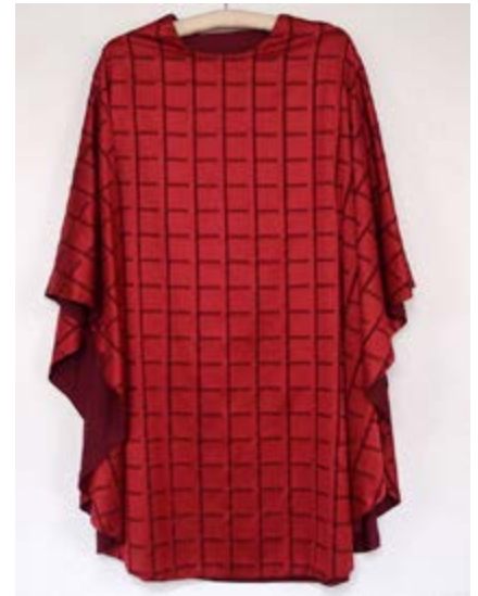
Couvent des capucines Sainte-Claire, Stans, chasuble d'Augustina Flüeler, vers 1960.