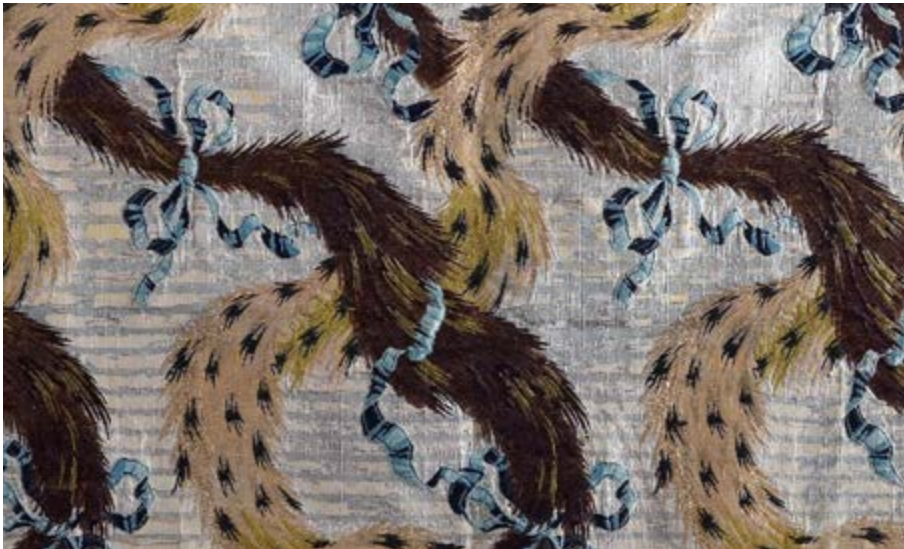
Collection Wolfgang Ruf, Beckenried, chape pluviale avec motif dit de fourrure, vers 1755/60.