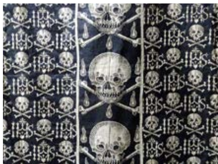
Abbaye bénédictine d'Engelberg, chasuble funéraire de 1700, ornée de motifs «Memento mori».