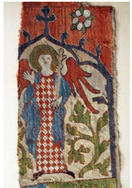
Couvent des bénédictines Saint-André à Sarnen: fragment textile représentant un ange, XIV e siècle.

Un autre aspect est, bien sûr, celui des tissus des vêtements. Il convient de signaler ici la relation entre les parements et l'esprit de l'époque: par exemple, les tissus les plus précieux produits pour la mode féminine et masculine contemporaine, tels que les soies avec des motifs dits de fourrure, étaient également utilisés pour les chasubles à l'époque baroque.